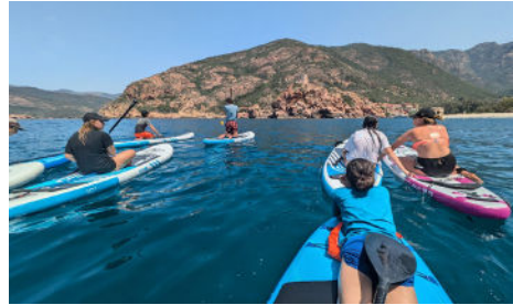
Ⓢ Séjour ados à Porto