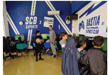
Ⓢ E-sport avec le SCB