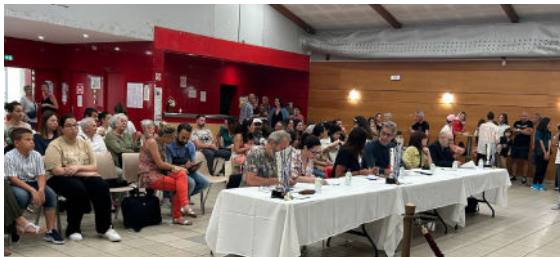
⌚ Journée des talents