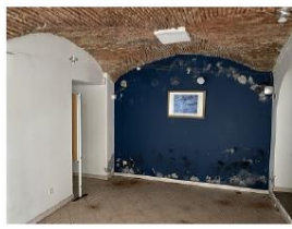
bureau (mur du fond moisi)