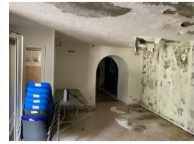
Pièce à usage de dépôt avec W-C à droite