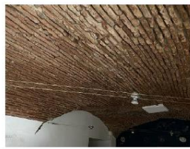
Plafond vouté en brique