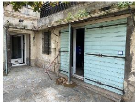
Entrée sur pièce à usage de bureau à gauche et sur dépôt à droite